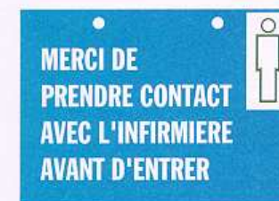
Pancartes de signalisation